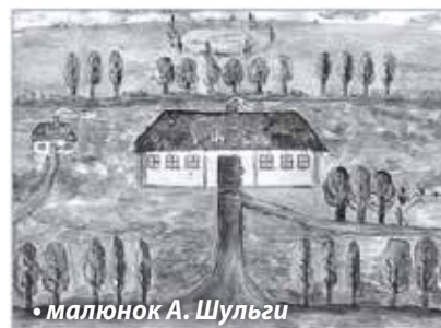
• малюнок А. Шульги